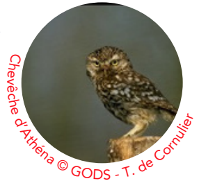
Chevêche d'Athéna

Petite chouette familière des paysages agricoles, la Chevêche d'Athéna est un rapace nocturne de taille modeste (environ 22 cm) au regard intense, marqué par de grands sourcils blancs. Véritable symbole des campagnes bocagères, elle affectionne les milieux ouverts ponctués d'arbres isolés, de vieux vergers et de haies.