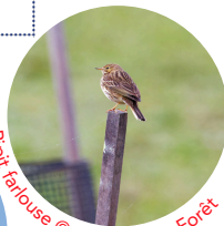
Pipit farlouse