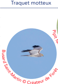
Busard Saint-Martin