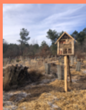
Installation de nichoirs et d'un hôtel à insectes confectionnés par les éco-délégués du Collège de la Force