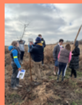
Mise en place de stations météo par les éco-délégués du Collège de la Force