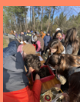
Animation vers de terre par l'association Pour les Enfants du Pays de Beleyme