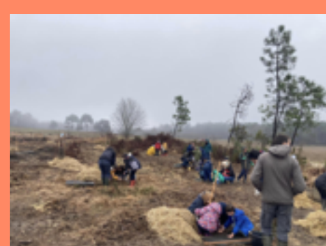
Visite des écoles de Manzac, Neuvic et Grignols

Le chantier du Bois de l'Esper a été rythmé par des animations, par les visites de nos chérubins, par l'installation d'habitats pour les oiseaux et les insectes, par la mise en place de station météo, par le paillage du cheminement, etc... Retrouvez en image tous ces moments qui ont apporté une valeur et une richesse sans précédent à cet flot de biodiversité en devenir.