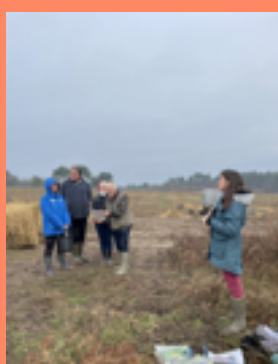
Animation oiseaux par l'association Pour les Enfants du Pays de Beleyme